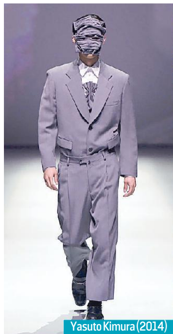
Yasuto Kimura (2014)